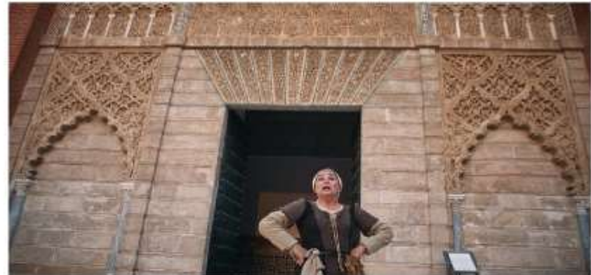
Un momento de las visitas al Real Alcázar

• Vuelve el Premio de Pintura del Ateneo de Sevilla