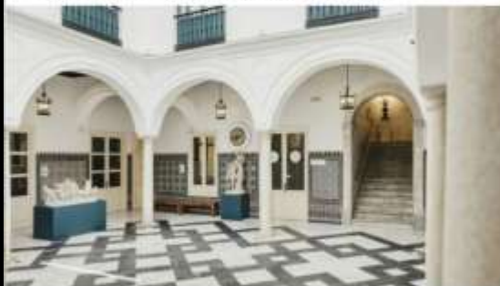
Casa Fabiola-Donación Mariano Bellver acoge un ciclo de teatro con motivo del 150 Aniversario del nacimiento de los Hermanos Álvarez Quintero. / M. G.

El patio de Casa Fabiola, edificio de referencia sobre el romanticismo en la ciudad, que cuenta con un total de 567 obras donadas al Ayuntamiento de Sevilla por el coleccionista Mariano Bellver, será así el escenario en el que se representen durante los meses de mayo , y junio : Los Álvarez Quintero en Casa Fabiola a cargo de Cías. AlmaTwins/Dos Lunas Teatro